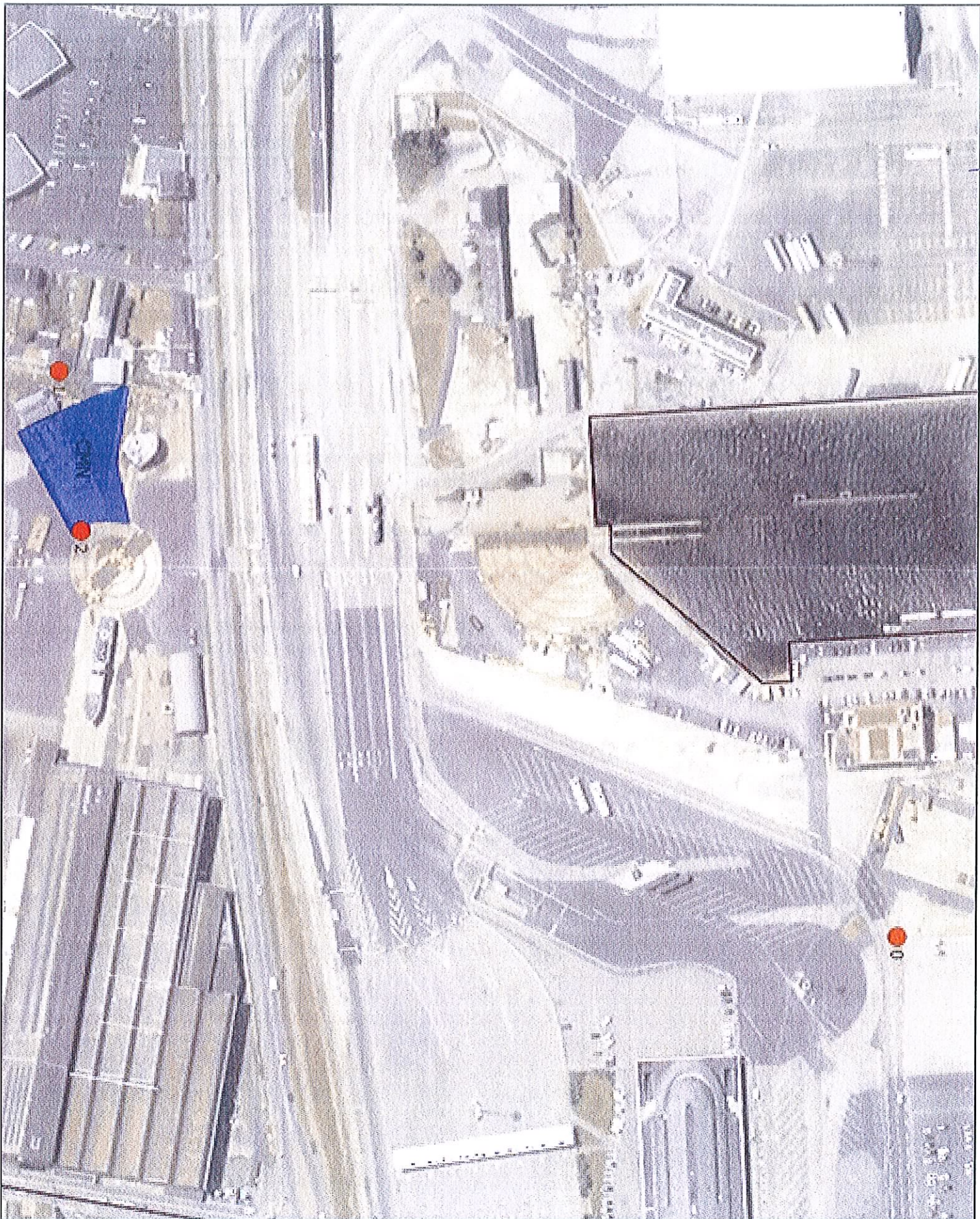
Figure 1: Map of the area around the stadium.